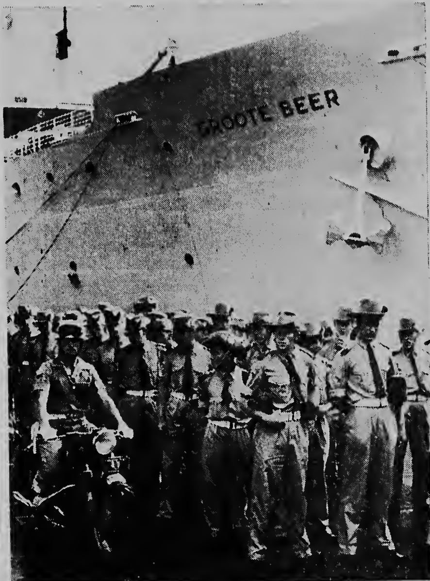
Infanteristanan Neerlandes dilanti e bapor „Groote Beer” cual ayera a pasa Corsow riba su biahe pa Nueva Guinea.

Groote Beer a tira su anker na Westwrf (Di nos Corresponsal na Corsow) WILLEMSTAD, 12 october.— Nos a mira masha hopi solda ta camna den e cajan di Willemstad ayera y despues di a haci mas informacion nos a bin hanja tende cu esquinan tabata un unidad di infanteria cu a bin abordo di „Groote Beer” di Holland Amerika Lijn, cual vapor na cargo di gobierno neerlandes ta bai haci un viaje na Nueva Guinea.